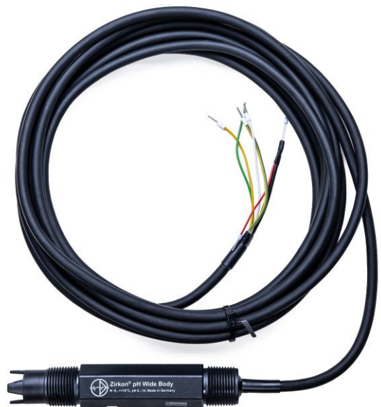
Zirkon® pH Wide Body